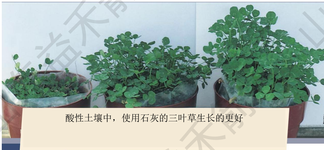
酸性土壤中，使用石灰的三叶草生长的更好

■ 石灰施用量应以 pH 值在 5.2 至 5.5 之间为目标。在此 pH 值以上施用石灰可引起微量元素缺乏。