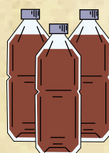
活化 EM-1 4-5L