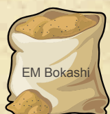
EM 博卡西 700g 也可用稻糠代替